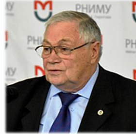
академик РАН И.И. Затевахин