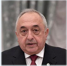
академик РАН Р.С. Акчурин