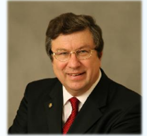
академик РАН Ю.В. Белов