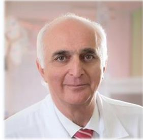
академик РАН Б.Г. Алекаян