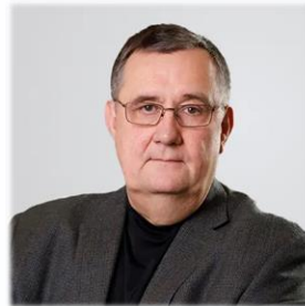
член-корр. РАН С.А. Абугов